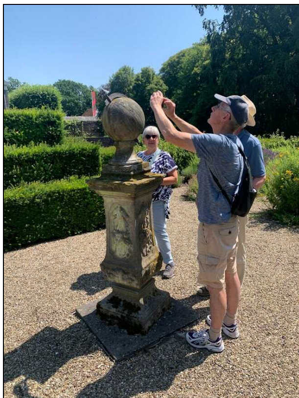
Bolzonnewijzer met dubbele schaduwgever bij de borg Verhildersum

In de tuin van de Borg staat een stenen bolzonnewijzer met een dubbel uitgevoerde meridiaanboog als schaduwgever. Tussen de beide delen van de boog zit een spleet, zodat het licht daartussen kan vallen en een lichtstreep op de bol geeft. In dit geval dus geen schaduw die de tijd geeft, maar licht.