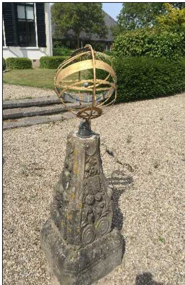
Armillosfeer voor boerderij Welgelegen bij de borg Verhildersum; inmiddels verwijderd

Verhildersum is een borg waarvan de bouw in de veertiende eeuw begonnen is. Bij het passeren van de bijbehorende boerderij Welgelegen zien we de lege sokkel waarop tot voor kort een armillosfeer stond. Deze laatste is op last van de verzekerings-maatschappij weggehaald omdat hij 'niet nagelvast zat'.