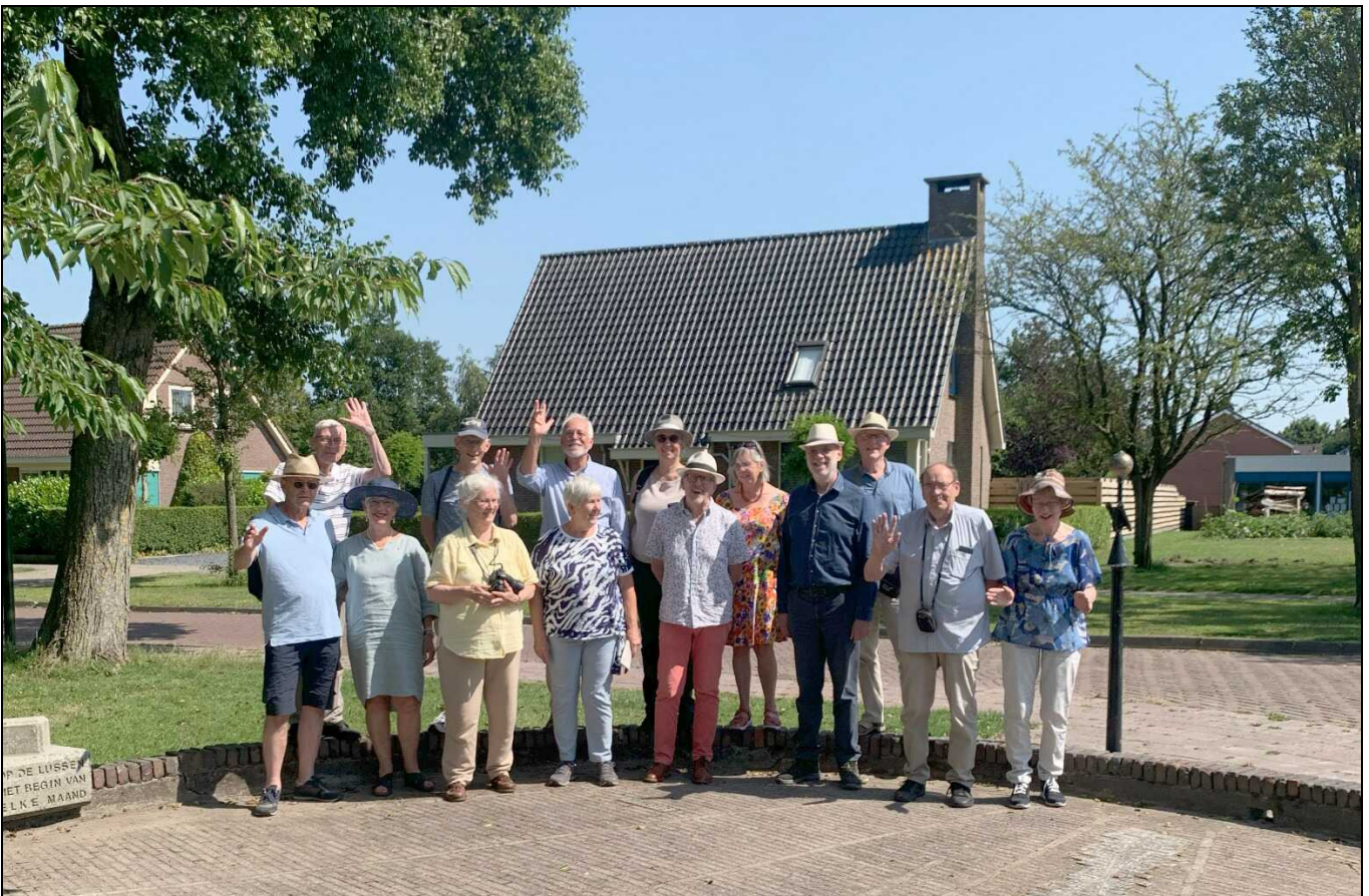
De deelnemers bij de puntzonnewijzer (rechts van de groep) in Eenrum