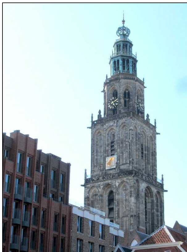
'd'Olle Grieze': Martinitoren met oostafwijkende zuidwijzer