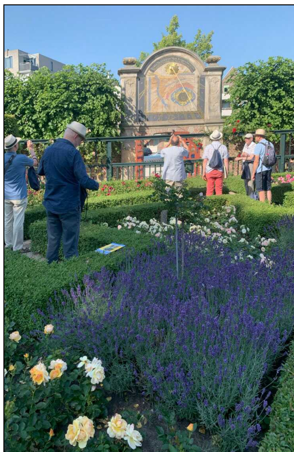
Prinsenhofstuin met de grote zonnepijzer