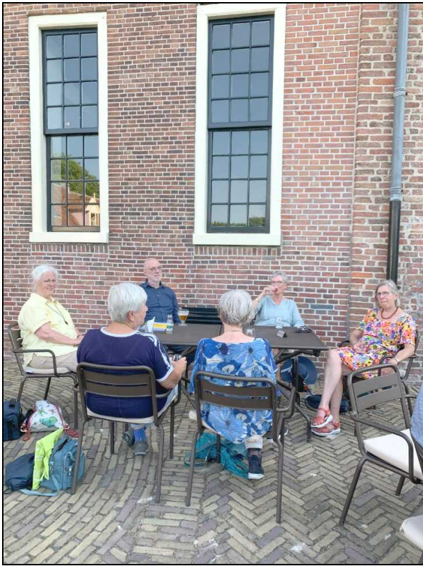
Prinsenhof: terras en eindhalte

Als we ons omdraaien zien we het terras van het Prinsenhof in de schaduw, waar de ober op ons wacht met een warm hapje en een verkoelend drankje.