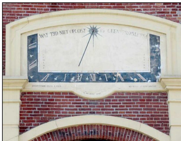
Zuidwijzer Lijnbaanstraat, Groningen