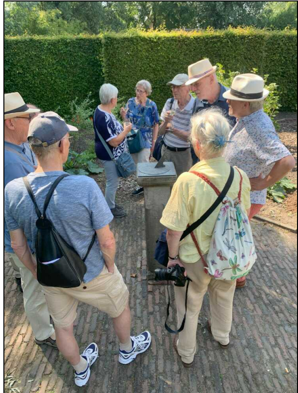
Bij restaurant 'Onder de Linden', Aduard

De poolster Polaris staat echter niet precies op de hemelpool, maar loopt daar in iets minder dan 24 uur