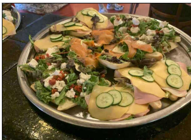
Lunch op Verhildersum

Na een korte busrit arriveren we in Kleine Huisjes, van oorsprong een nederzetting van landarbeiders, met