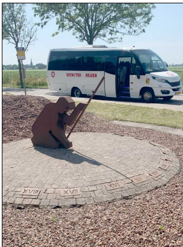
Zonnewijzer bij Kleine Huisjes

tegenwoordig tachtig inwoners. Dit is ons noordelijkste punt voor vandaag.